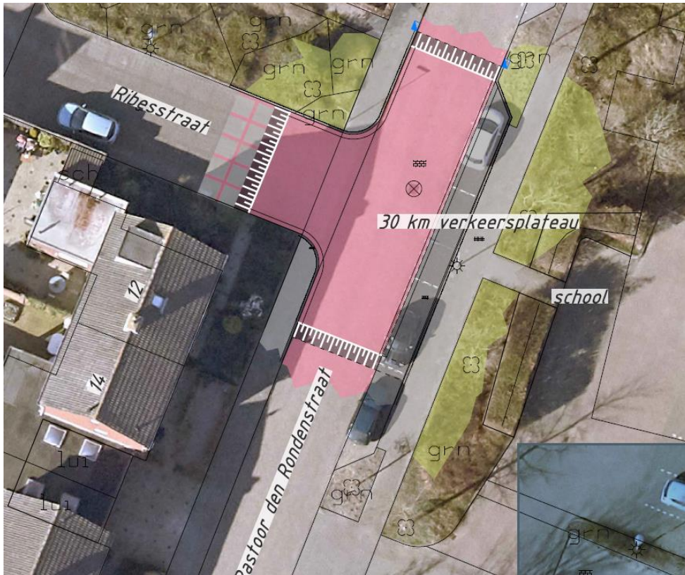
Afbeelding 1. Verkeersplateau Ribbesstraat / Pastoor den Rondenstraat